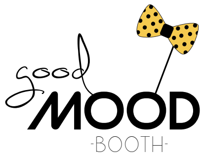
FOTO OGLEDALO GOOD MOOD BOOTH